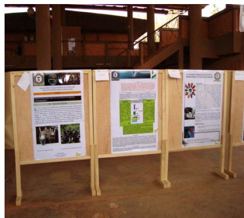
Vue partielle des posters en compétition.

Des posters de laboratoires de recherches et de filières de formations étaient exposés.